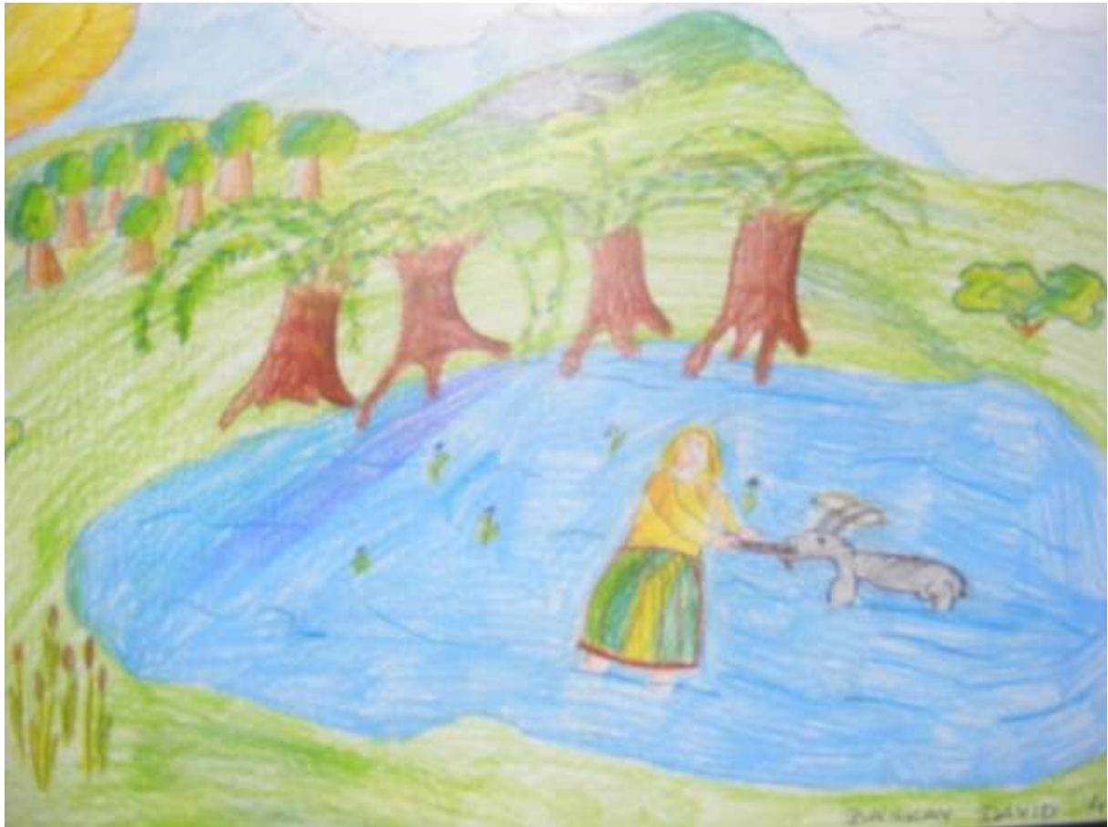
Báskay Dávid díjnyertes rajza (4. b)